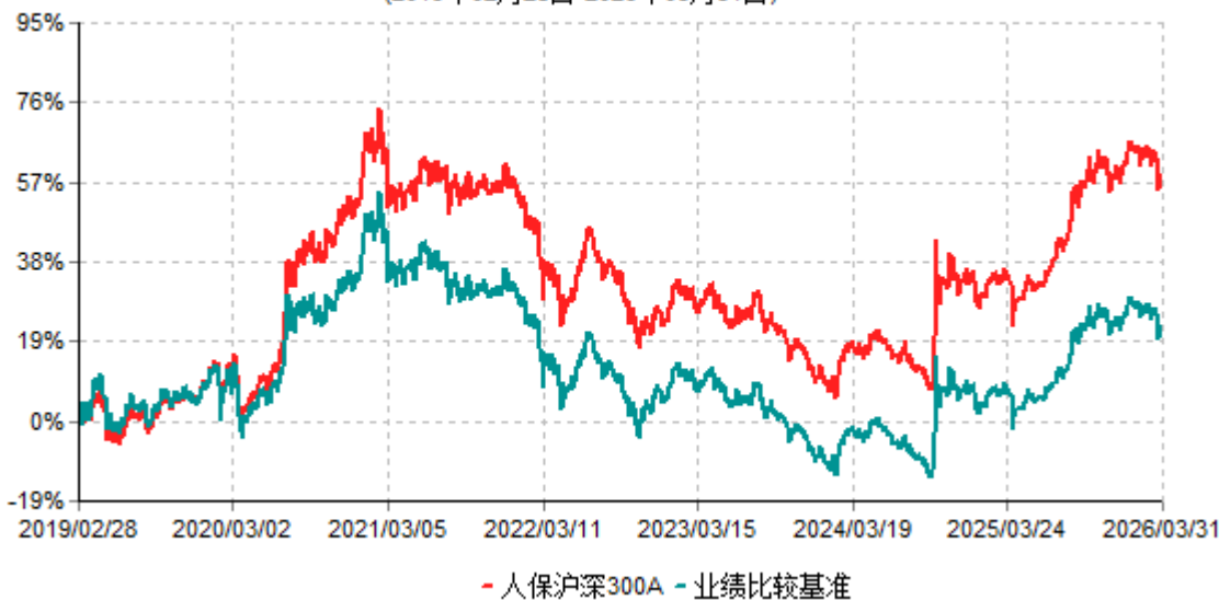
人保沪深300A累计净值增长率与业绩比较基准收益率历史走势对比图 (2019年02月28日-2026年03月31日)