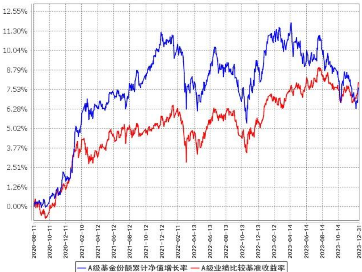
A级基金份额累计净值增长率与同期业绩比较基准收益率的历史走势对比图 (2020年8月11日至2023年12月31日)