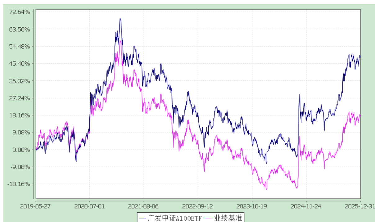
广发中证 A100 交易型开放式指数证券投资基金 份额累计净值增长率与业绩比较基准收益率的历史走势对比图 (2019 年 5 月 27 日至 2025 年 12 月 31 日)