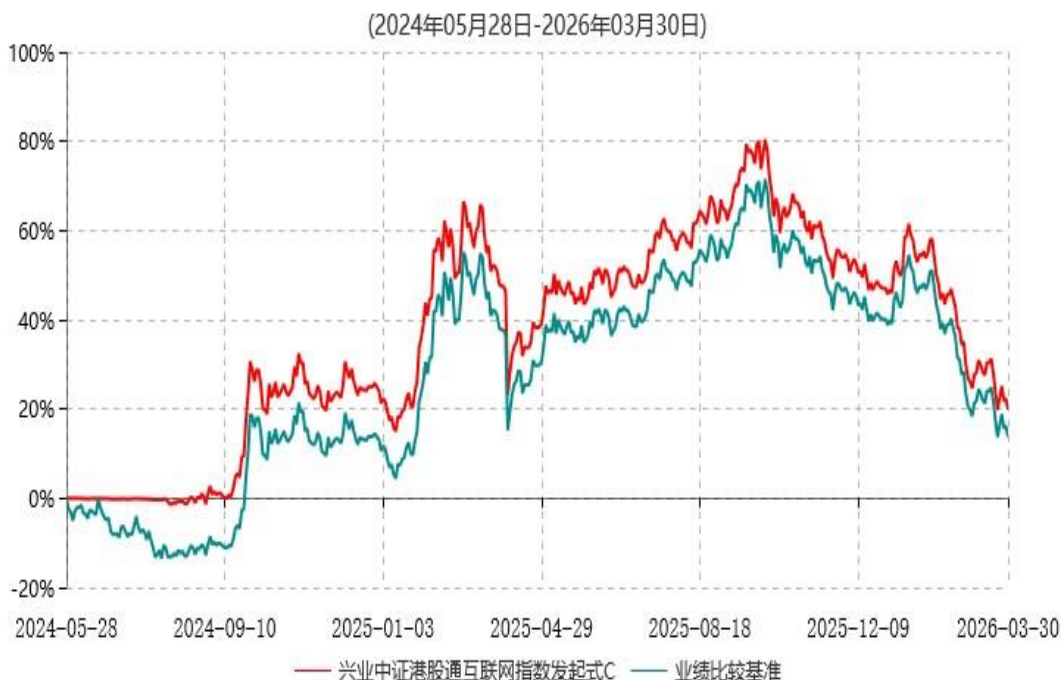
兴业中证港股通互联网指数发起式C累计净值增长率与业绩比较基准收益率历史走势对比图

注:根据公告《关于兴业中证港股通互联网指数型发起式证券投资基金变更为兴业中证港股通互联网交易型开放式指数证券投资基金发起式联接基金并修改基金合同及托管协议的公告》,自2026年3月31日起,兴业中证港股通互联网指数型发起式证券投资基金正式变更为兴业中证港股通互联网交易型开放式指数证券投资基金发起式联接基金,《兴业中证港股通互联网交易型开放式指数证券投资基金发起式联接基金基金合同》生效,原《兴业中证港股通互联网指数型发起式证券投资基金基金合同》自同日失效。