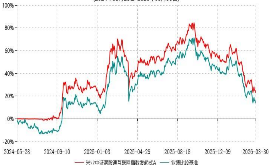
兴业中证港股通互联网指数发起式A累计净值增长率与业绩比较基准收益率历史走势对比图 (2024年05月28日-2026年03月30日)

注: 根据公告《关于兴业中证港股通互联网指数型发起式证券投资基金变更为兴业中证港股通互联网交易型开放式指数证券投资基金发起式联接基金并修改基金合同及托管协议的公告》, 自2026年3月31日起, 兴业中证港股通互联网指数型发起式证券投资基金正式变更为兴业中证港股通互联网交易型开放式指数证券投资基金发起式联接基金