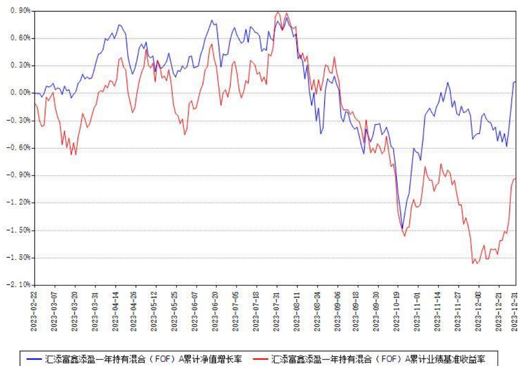
汇添富鑫添盈一年持有混合（FOF）A 累计净值增长率与同期业绩基准收益率对比图