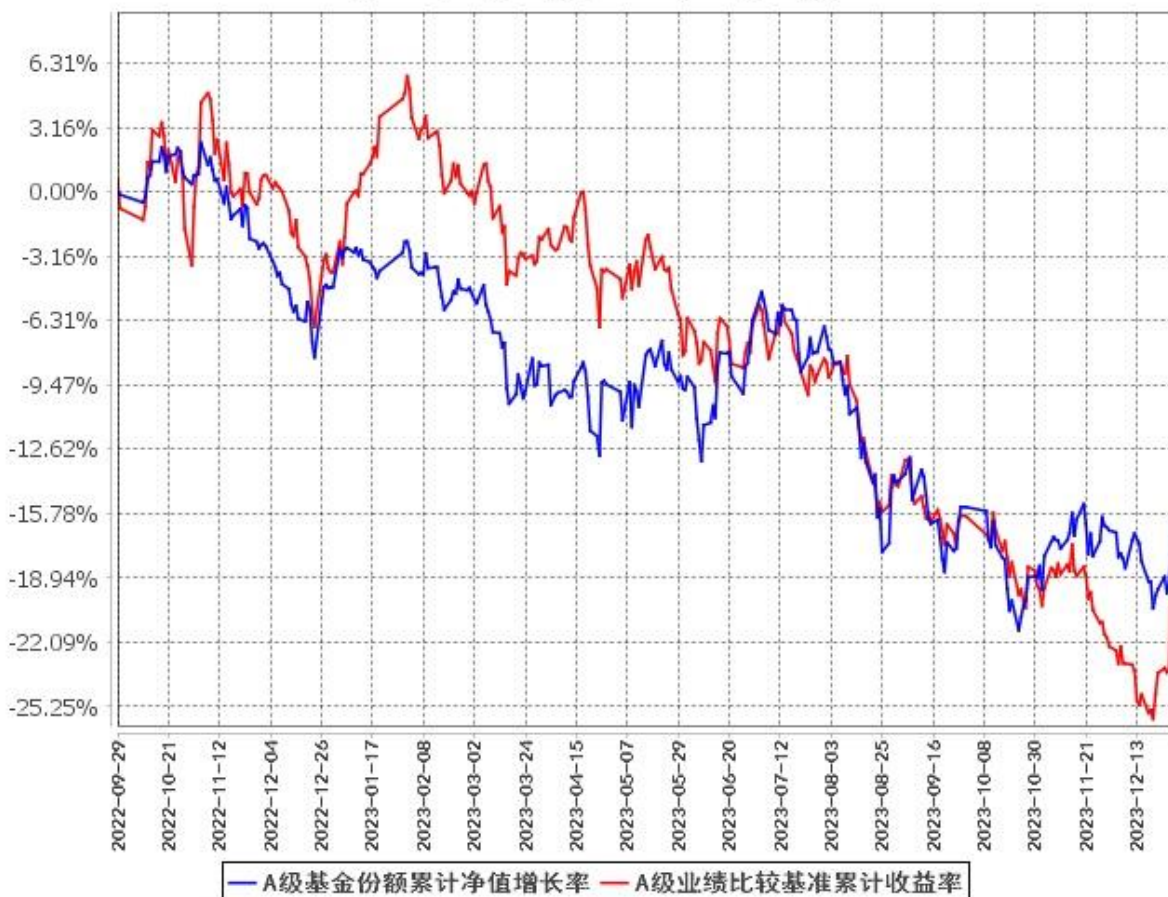
A级基金份额累计净值增长率与同期业绩比较基准收益率的历史走势对比图 (2022年9月29日至2023年12月31日)