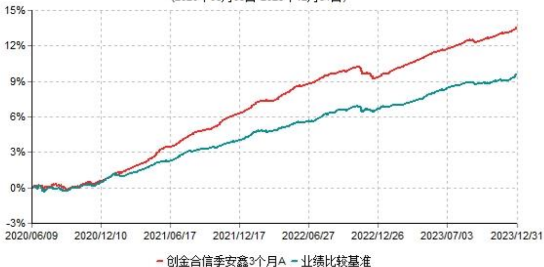
创金合信季安鑫3个月A累计净值增长率与业绩比较基准收益率历史走势对比图 (2020年06月09日-2023年12月31日)