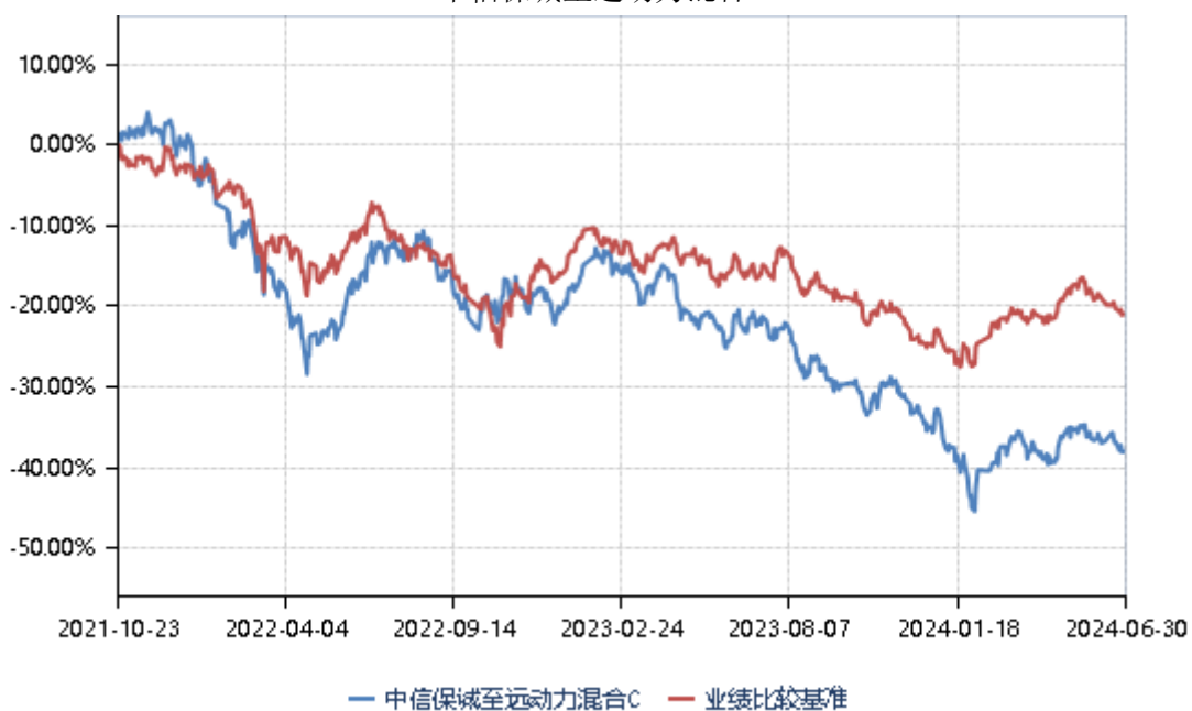
中信保诚至远动力混合 E