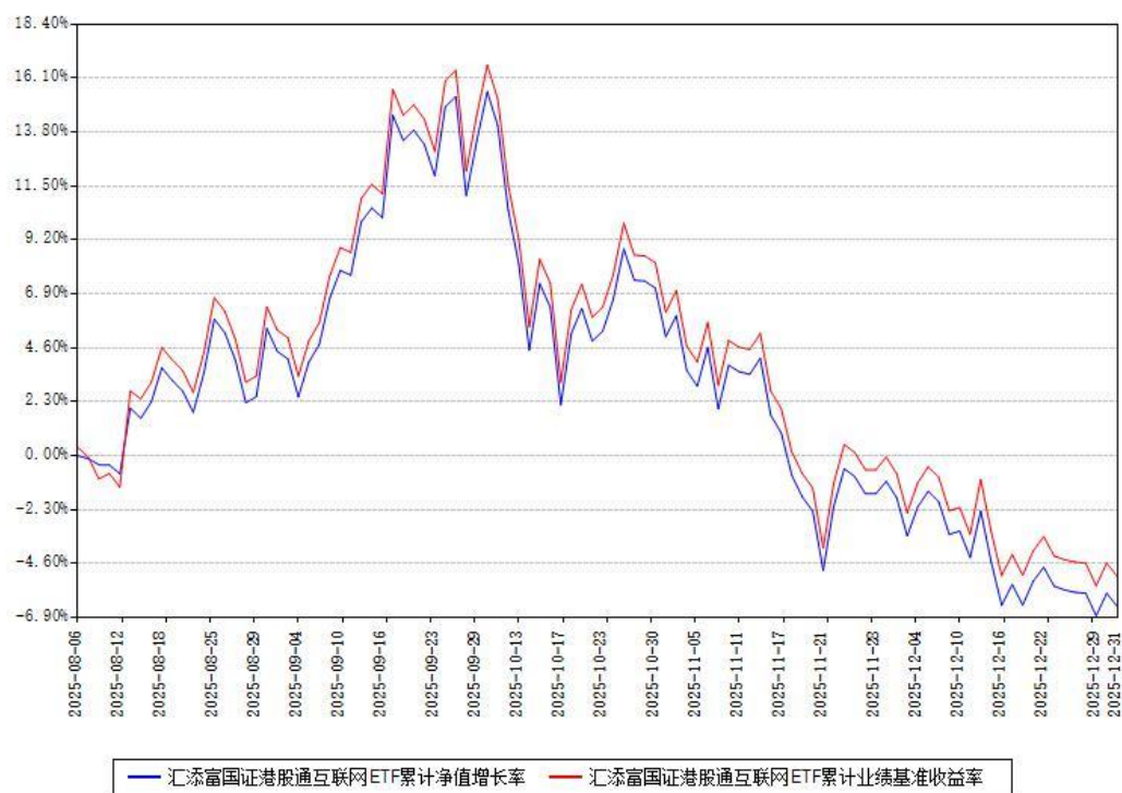
汇添富国证港股通互联网ETF累计净值增长率与同期业绩基准收益率对比图

注：本《基金合同》生效之日为 2025 年 08 月 06 日，截至本报告期末，基金成立未满一年。本基金建仓期为本《基金合同》生效之日起 6 个月，截至本报告期末，本基金尚处于建仓期中。