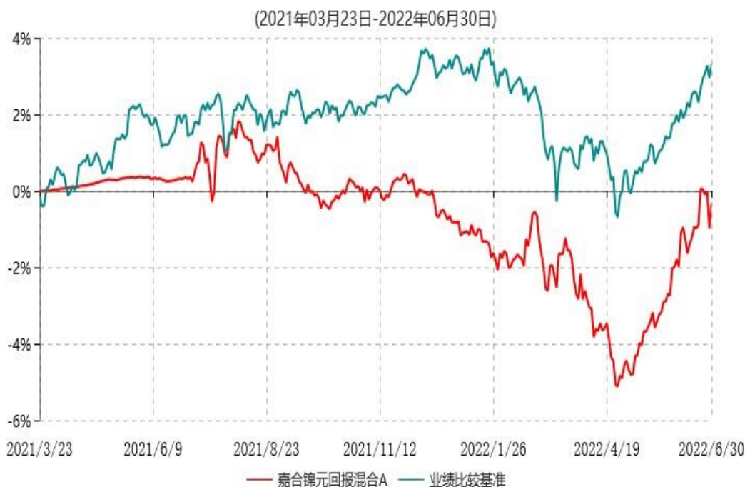
嘉合锦元回报混合A累计净值增长率与业绩比较基准收益率历史走势对比图