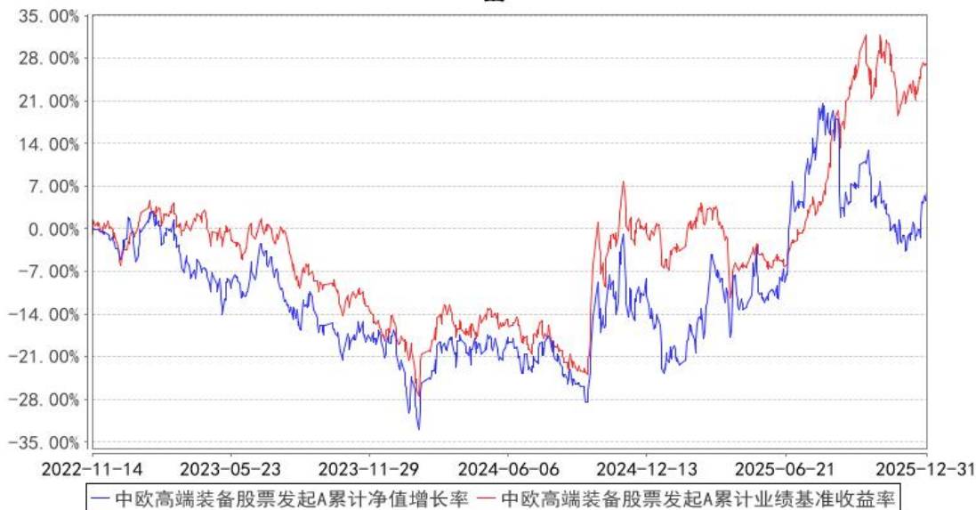
中欧高端装备股票发起A累计净值增长率与同期业绩比较基准收益率的历史走势对比图