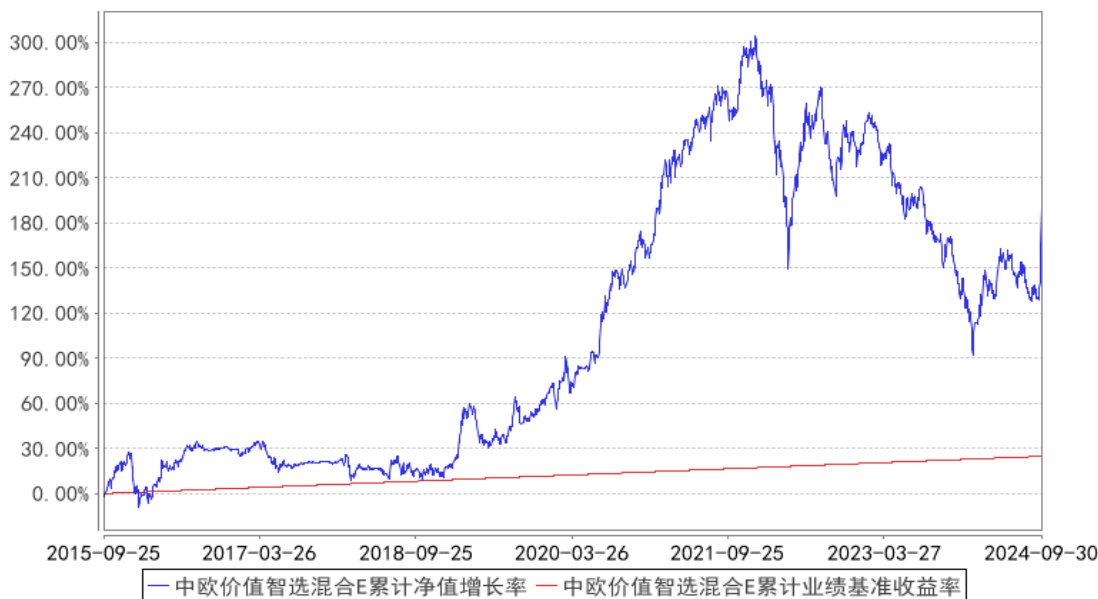
中欧价值智选混合E累计净值增长率与同期业绩比较基准收益率的历史走势对比图

注：本基金于 2015 年 9 月 22 日新增 E 类份额。图示日期为 2015 年 9 月 25 日至 2024 年 09 月 30 日。