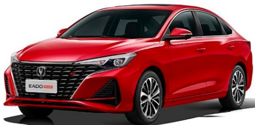
2022 款逸动 PLUS

2022 款逸动 PLUS，搭载蓝鲸新一代 NE 1.4T 高效动力组合，实现高动力与低油耗的完美平衡；俊朗运动造型，动感光影渐进式前格栅，极简天际霓虹贯穿式 LED 尾灯，整车姿态协调富有韵律；环抱式驾舱，搭配双 10.25 英寸联屏尽显智慧科技，精致游艇式电子档杆、手机无线充电、全新 Incall3.0S 智能交互系统及智行驾驶辅助系统，让整车造型与品质获得更全面的进化。