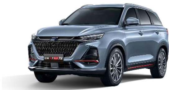
欧尚X7 PLUS 7座版

欧尚 X7 PLUS 7 座版，基于欧尚 X7 PLUS 优秀品质再度变革舱内空间，聚焦多人出行场景，以场景化营销打造“10 万级家享精品 7 座 SUV 首选”标签。多变大空间 SUV，7 座+280L 后备箱空间或 5 座+780L 后备箱空间，自如切换，2786mm 同级领先轴距，二排座椅靠背 15° 至 35° 区间调节，三排座椅 270mm 座垫高度、26° 座椅靠背角，更具实用性。满足用户家庭多人出行的全场景用车体验。