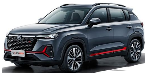
2022 款 CS35 PLUS

锐程 PLUS，新一代智能宽适家轿。参数化渐变格栅、天际流 LED 灯组、环绕智享轻奢座舱，雅致新中式轻奢设计超安逸；2770mm 超长轴距、全系增强式四轮独立悬架，一体式零压感座椅；蓝鲸新一代 NE 1.5T 高压直喷发动机匹配蓝鲸新一代 7 速湿式双离合变速器；“AI 小安”智能语音；高强度吸能式车身，高品质制造工艺、高标准验证体系，多重守护，放心出行。