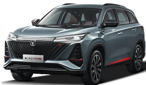
第二代 CS75 PLUS

UNI-K iDD 是长安乘用车高端序列 UNI 旗下的首款 PHEV 产品，亦是长安首款搭载 iDD 智能电混系统（intelligent Dual Drive 全域智能油电双驱系统）的产品。UNI-K iDD 延用新科技智慧美学设计理念，呈现未来感的品质美学；基于全域高效电气平台打造，实现“全速域、全场域、全温域、全时域”的卓越、经济、安全、动力性能。未来科技智慧座舱，让汽车不再只是简单的出行工具，更是人性的延伸和情感的外化，亦是兼具智慧、智能，以及情感判断和审美体验的智慧伙伴。