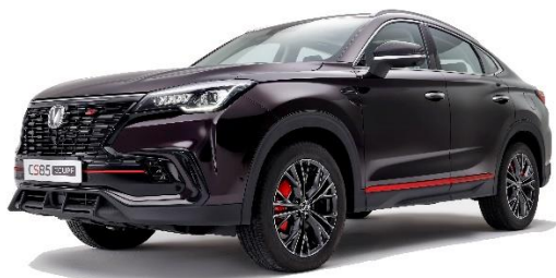
2023 款 CS85 COUPE

2023 款 CS85 COUPE，以穹顶流光式溜背设计，星钻大灯，双色轮毂，黑色碳纤维后视镜，彰显运动魅力。采用红黑双色经典搭配。以环抱式星际驾舱，全景星空天窗，超纤皮座椅，创领舒适驾驶新高度。以蓝鲸新一代 NE 1.5T 高压直喷发动机+7DCT 动力组合，博世电子稳定制动系统，全系电子换挡，怠速起停技术。以腾讯 TAI 汽车智能系统，IACC 集成式自适应巡航系统，APA4.0 代客泊车系统，540°高清全景影像系统，PAB 预警辅助制动系统。