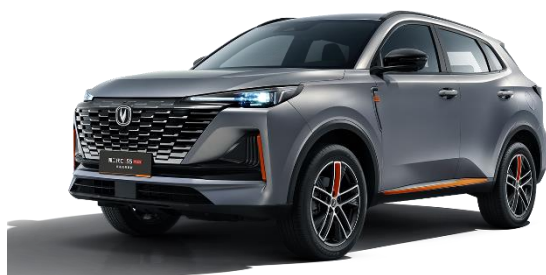
第二代CS55PLUS风暴灰限量款

2022 款逸动 PLUS，搭载蓝鲸新一代 NE 1.4T 高效动力组合，实现高动力与低油耗的完美平衡；俊朗运动造型，动感光影渐进式前格栅，极简天际霓虹贯穿式 LED 尾灯，整车姿态协调富有韵律；环抱式驾舱，搭配双 10.25 英寸联屏尽显智慧科技，精致游艇式电子档杆、手机无线充电、全新 Incall3.0S 智能交互系统及智行驾驶辅助系统，让整车造型与品质获得更全面的进化。