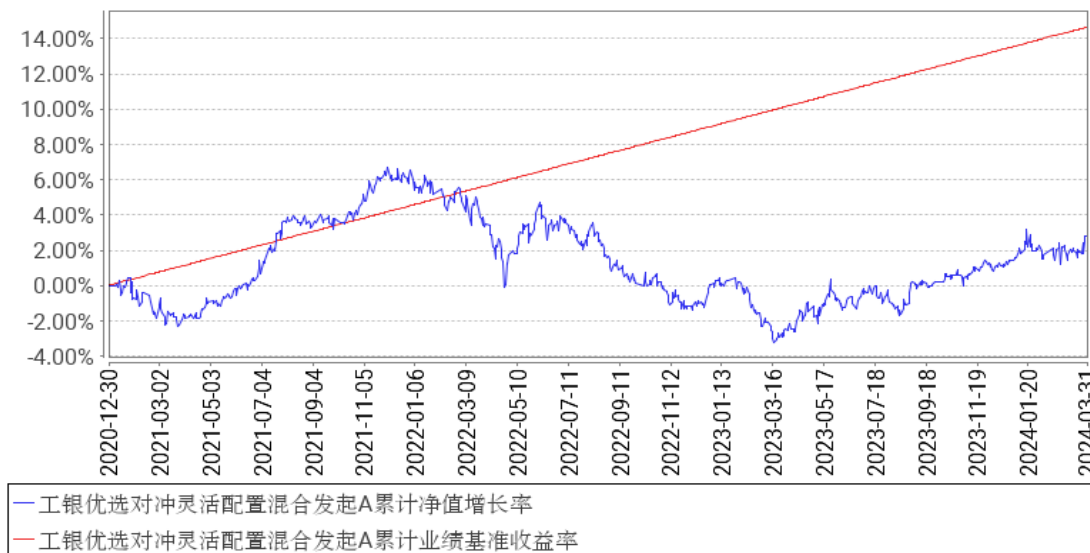
工银优选对冲灵活配置混合发起A累计净值增长率与同期业绩比较基准收益率的历史走势对比图