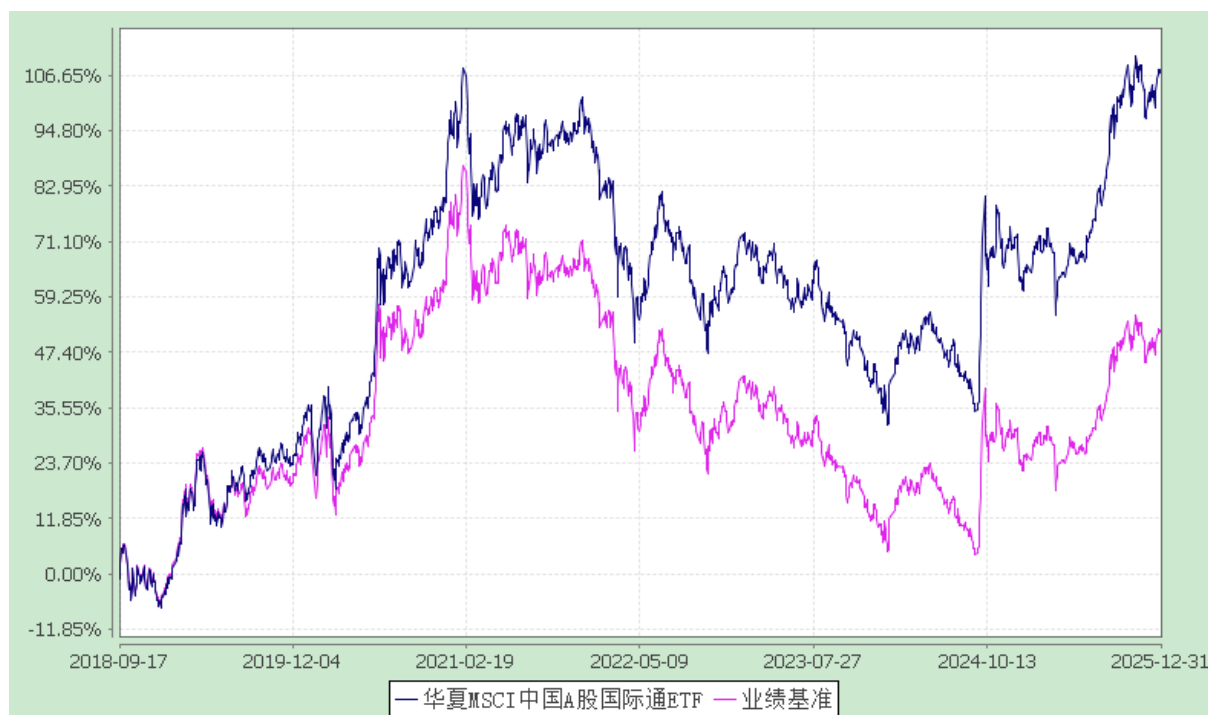
华夏 MSCI 中国 A 股国际通交易型开放式指数证券投资基金 份额累计净值增长率与业绩比较基准收益率历史走势对比图 (2018 年 9 月 17 日至 2025 年 12 月 31 日)

注：本基金自 2018 年 9 月 17 日起由“MSCI 中国 A 股交易型开放式指数证券投资基金”转型而来。