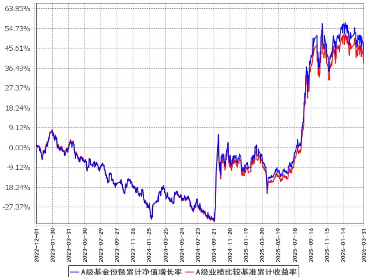
A级基金份额累计净值增长率与同期业绩比较基准收益率的历史走势对比图 (2022年12月1日至2026年3月31日)