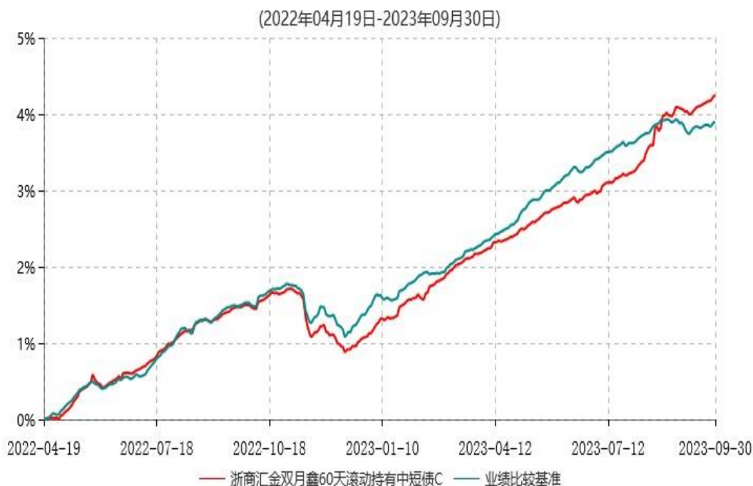
浙商汇金双月鑫60天滚动持有中短债C累计净值增长率与业绩比较基准收益率历史走势对比图

注：本基金合同生效日为 2022 年 04 月 19 日。至本报告期末，本基金已完成建仓，但报告期末距建仓结束不满一年，建仓期为 2022 年 04 月 19 日-2022 年 10 月 18 日，本基金建仓期结束时各项资产配置比例符合合同的约定。