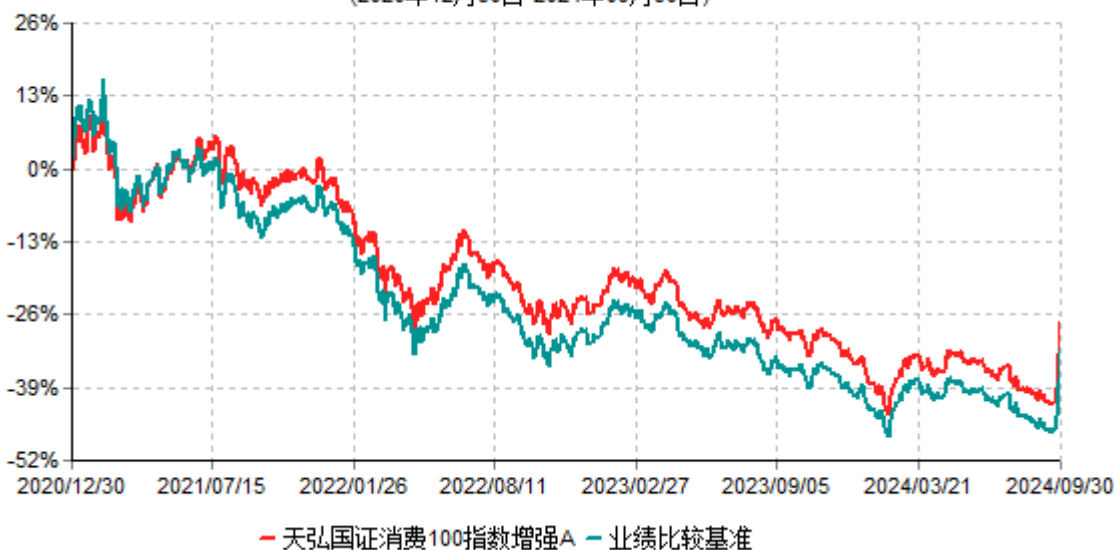
天弘国证消费100指数增强A累计净值增长率与业绩比较基准收益率历史走势对比图 (2020年12月30日-2024年09月30日)