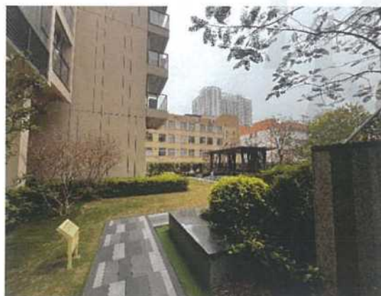
估价对象小区内部