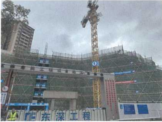
东侧大鹏敬老院在建工程