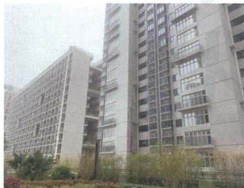
南侧深圳国际交流学院