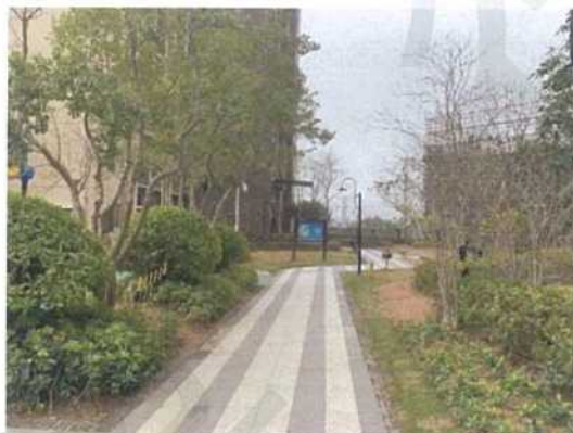
估价对象小区环境