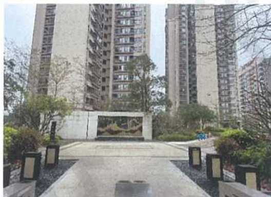
估价对象小区环境