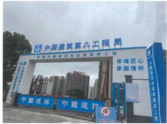
南侧深圳市大鹏新区妇幼保健院在建工程