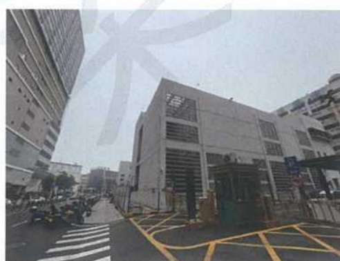
北侧南方电网变电所