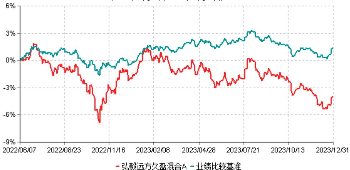
弘毅远方久盈混合A累计净值增长率与业绩比较基准收益率历史走势对比图 (2022年06月07日-2023年12月31日)