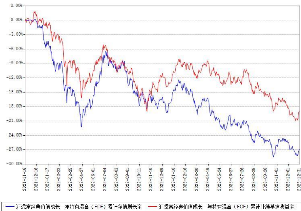
汇添富经典价值成长一年持有混合（FOF）累计净值增长率与同期业绩基准收益率对比图

注：本基金建仓期为本《基金合同》生效之日（2021年11月16日）起6个月，建仓期结束时各项资产配置比例符合合同约定。