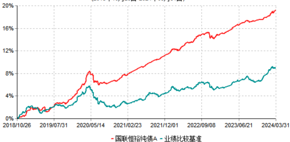
国联恒裕纯债A累计净值增长率与业绩比较基准收益率历史走势对比图 (2018年10月26日-2024年03月31日)