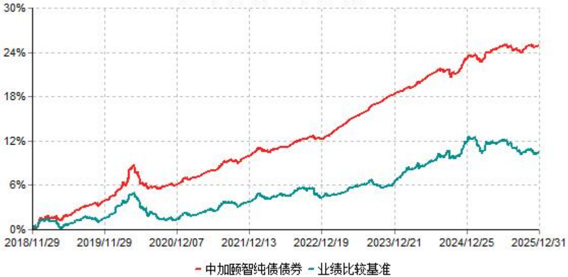
中加颐智纯债债券累计净值增长率与业绩比较基准收益率历史走势对比图 (2018年11月29日-2025年12月31日)