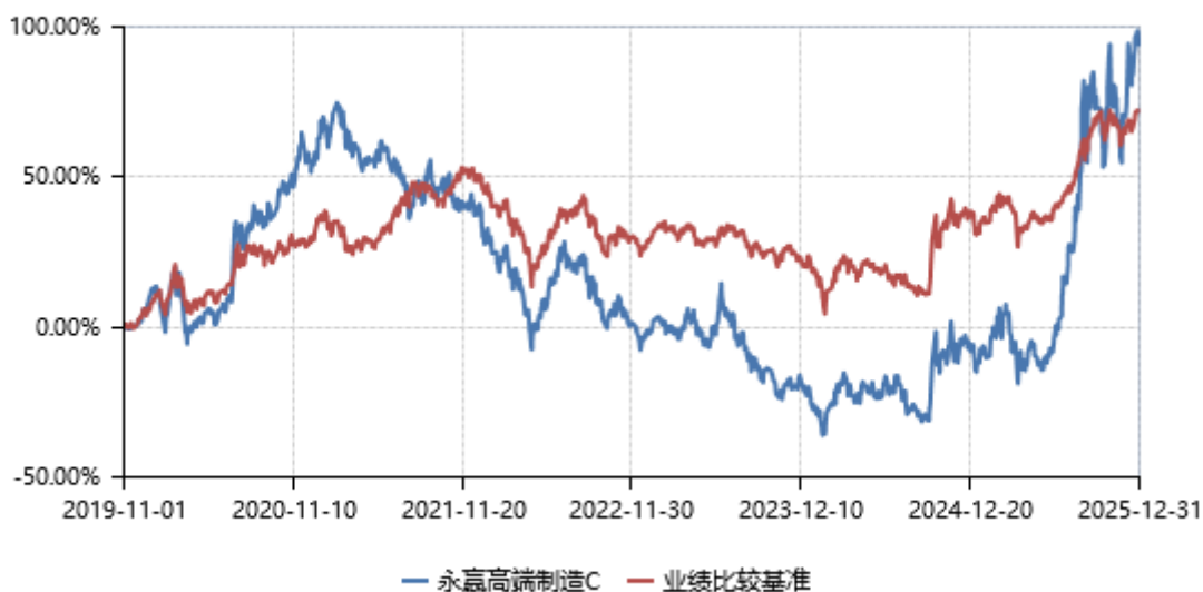
永赢高端制造C累计净值收益率与业绩比较基准收益率历史走势对比图 (2019年11月01日-2025年12月31日)