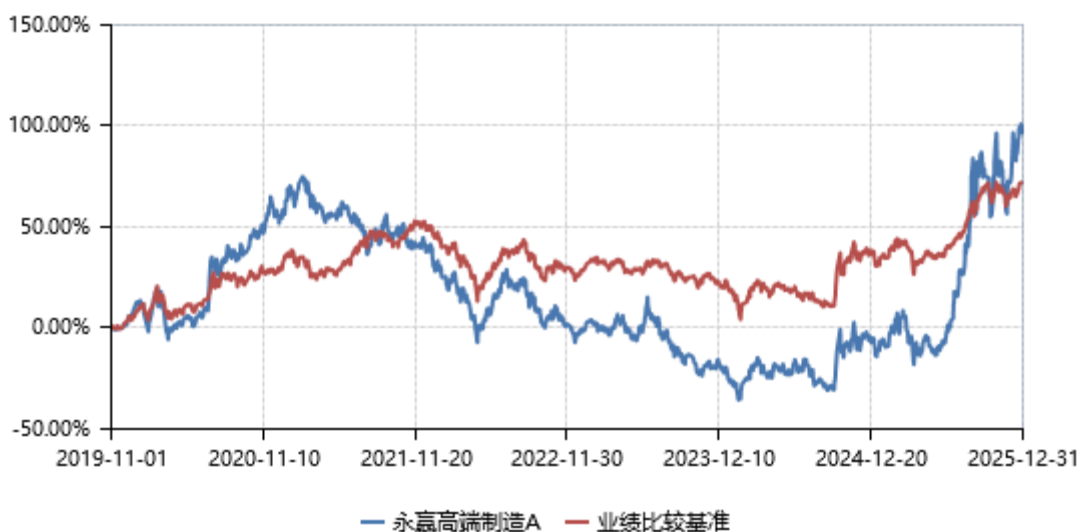
永赢高端制造A累计净值收益率与业绩比较基准收益率历史走势对比图 (2019年11月01日-2025年12月31日)