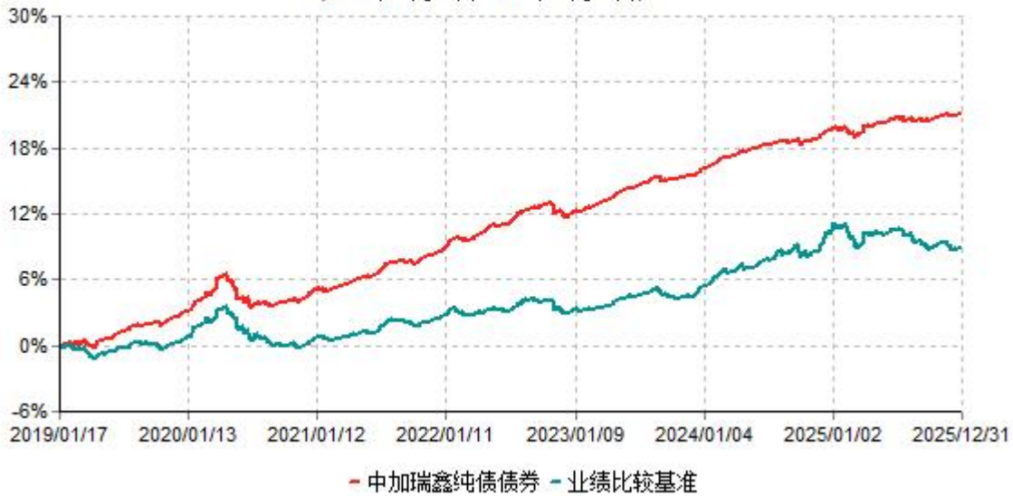
中加瑞鑫纯债债券累计净值增长率与业绩比较基准收益率历史走势对比图 (2019年01月17日-2025年12月31日)