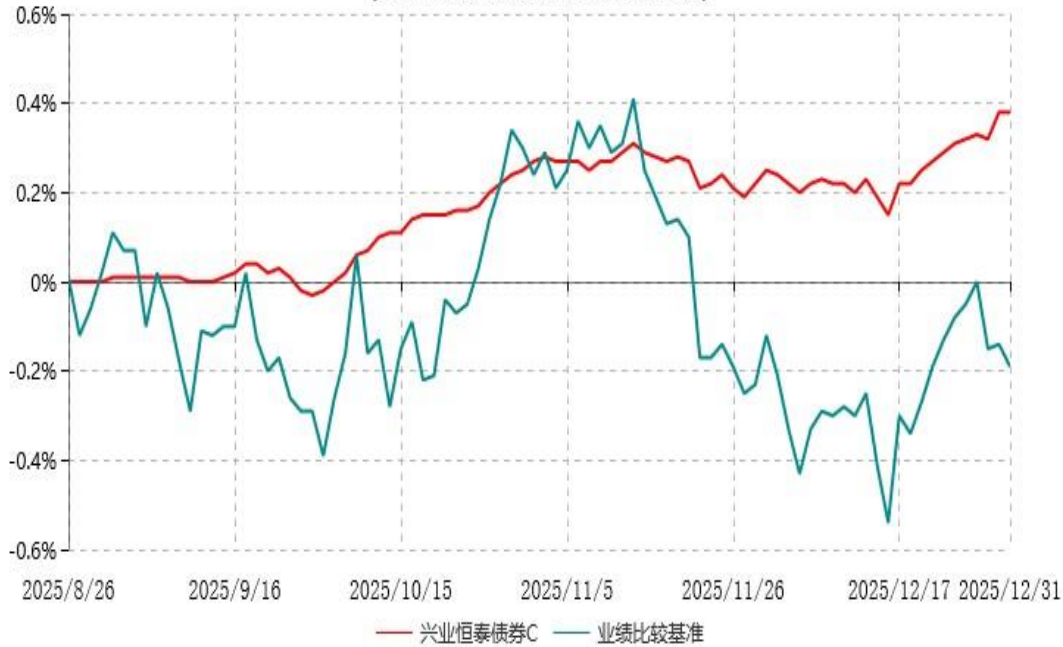
兴业恒泰债券C累计净值增长率与业绩比较基准收益率历史走势对比图 (2025年08月26日-2025年12月31日)

注：1、本基金基金合同于2025年8月26日生效，截至报告期末本基金基金合同生效未满一年。