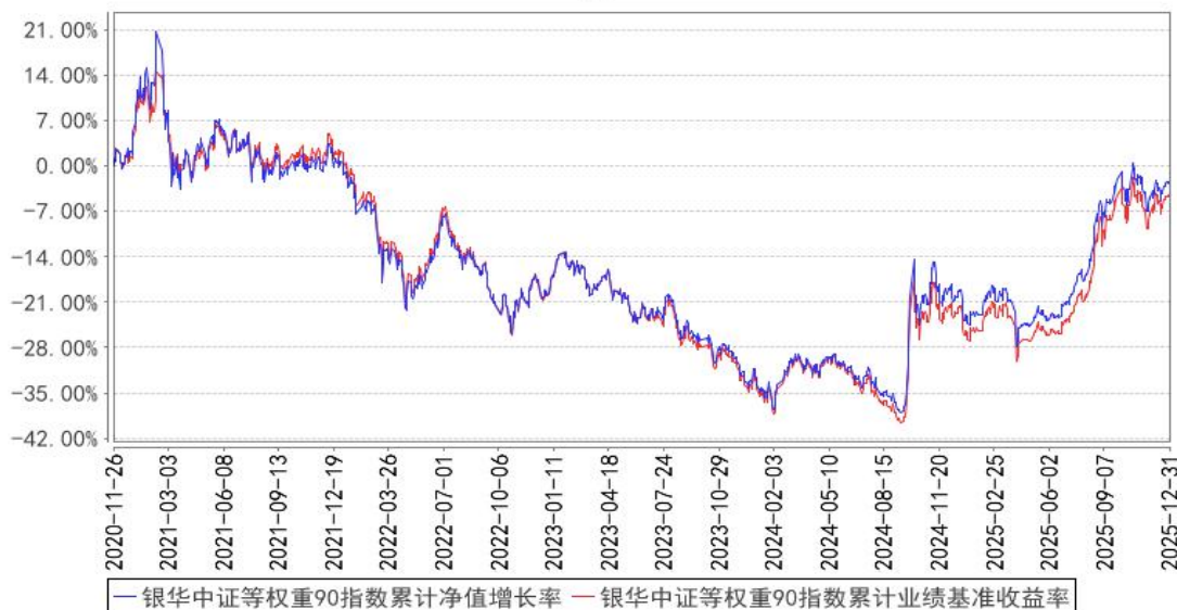
银华中证等权重90指数累计净值增长率与同期业绩比较基准收益率的历史走势对比图

注：按基金合同的规定，本基金自基金合同生效起六个月内为建仓期，建仓期结束时本基金的各项投资比例已达到基金合同的规定：本基金股票资产占基金资产的比例不低于 90%，投资于标的指数成份股及其备选成份股的比例不低于非现金基金资产的 80%。每个交易日日终，在扣除股指期货合约和股票期权合约需缴纳的交易保证金后，应保持不低于基金资产净值 5% 的现金或者到期