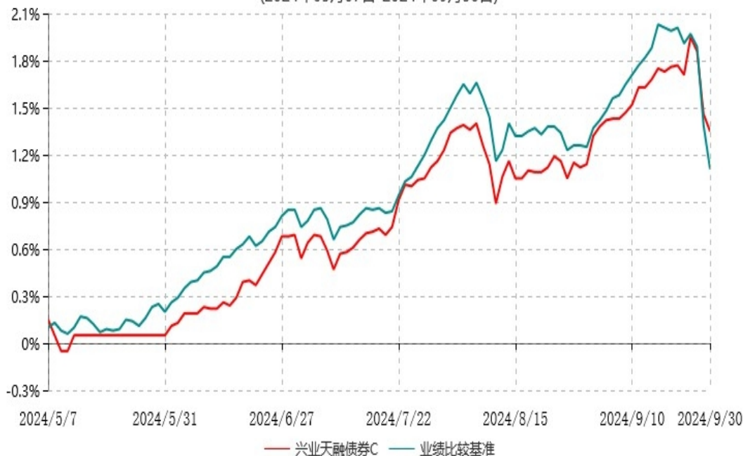
兴业天融债券C累计净值增长率与业绩比较基准收益率历史走势对比图 (2024年05月07日-2024年09月30日)

注：1、本基金的业绩比较基准自 2020 年 11 月 4 日起变更为：中国债券综合全价指数收益率。