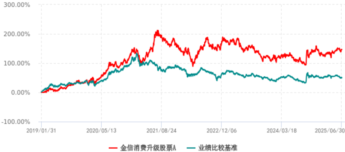
金信消费升级股票A累计净值增长率与业绩比较基准收益率历史走势对比图 (2019年01月31日-2025年06月30日)