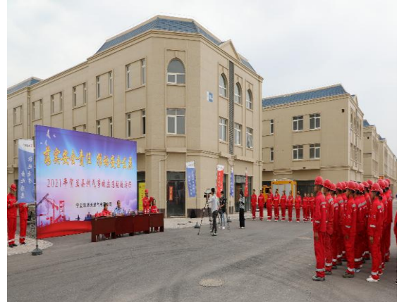
6月，公司开展燃气事故应急救援演练。