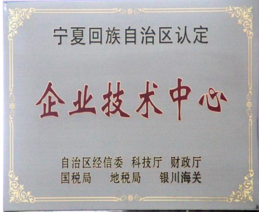
5月，公司技术中心复审通过宁夏回族自治区科技厅第三方评估认证通过