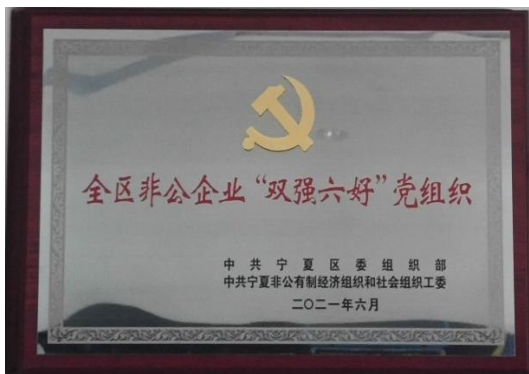
6月，公司荣获中共宁夏区委组织部颁发的全区非公企业“双强六好”党组织称号。