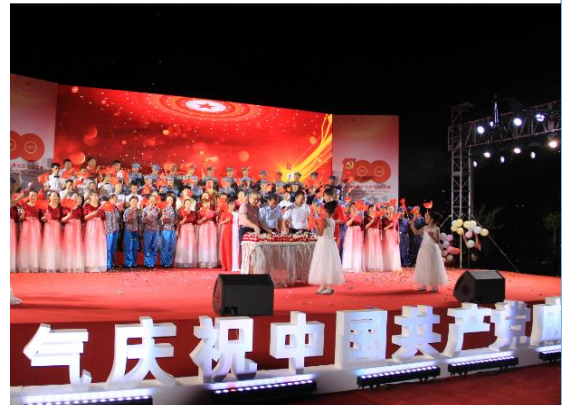
6月30日，公司举办“庆祝中国共产党建党一百周年庆典活动”，向党的生日献礼。