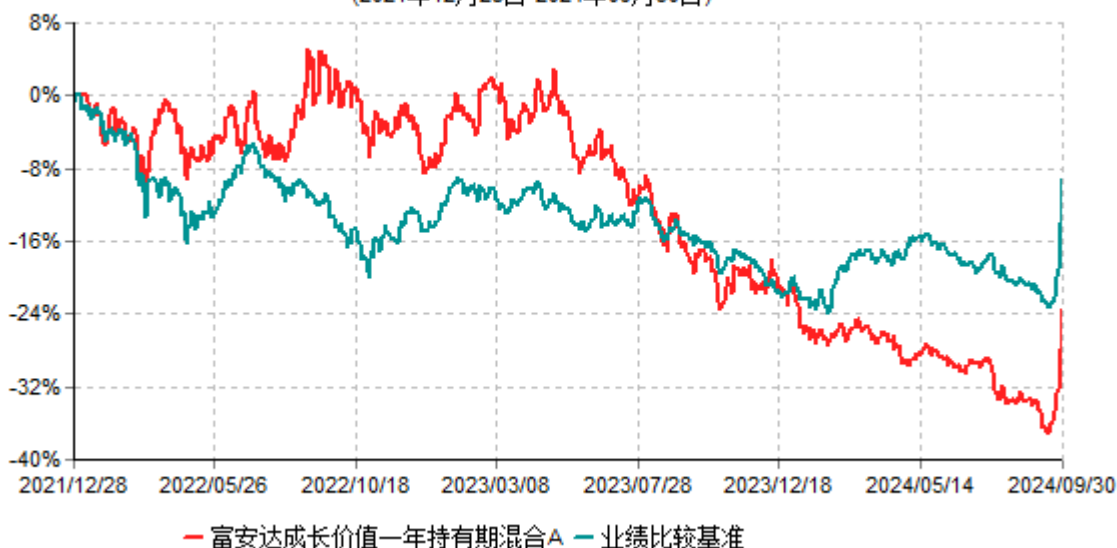
富安达成长价值一年持有期混合A累计净值增长率与业绩比较基准收益率历史走势对比图 (2021年12月28日-2024年09月30日)