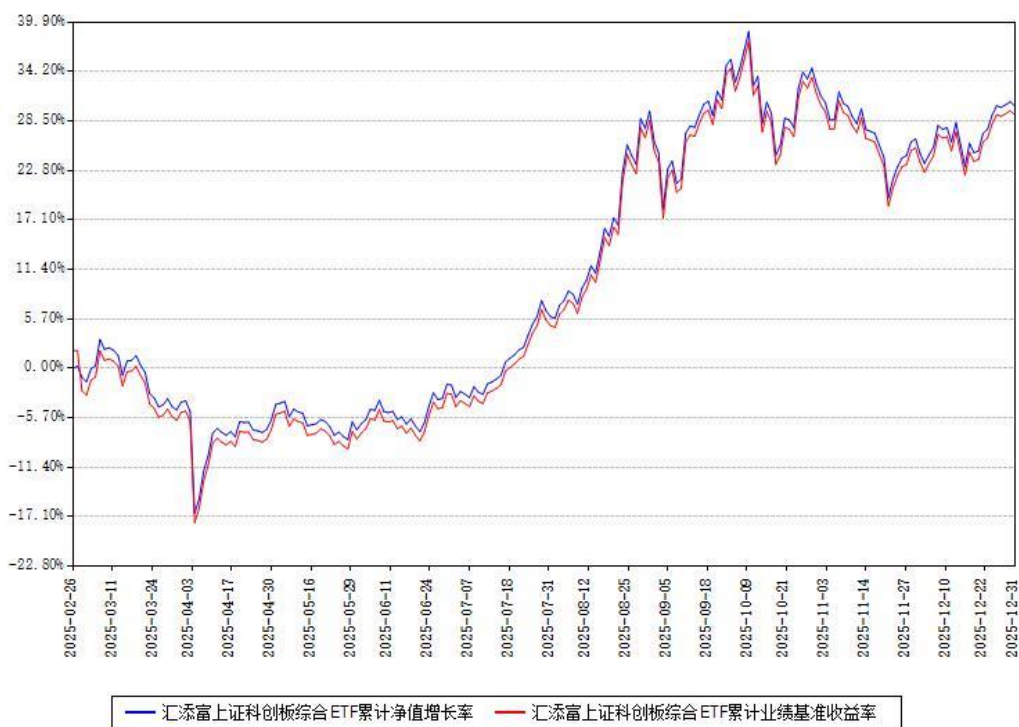
汇添富上证科创板综合ETF累计净值增长率与同期业绩基准收益率对比图

注：本《基金合同》生效之日为2025年02月26日，截至本报告期末，基金成立未满一年。本基金建仓期为本《基金合同》生效之日起6个月，截至本报告期末，本基金已完成建仓，建仓期结束时各项资产配置比例符合合同约定。