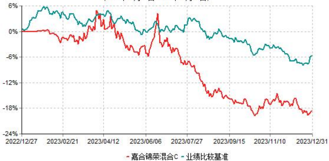
嘉合锦荣混合C累计净值增长率与业绩比较基准收益率历史走势对比图 (2022年12月27日-2023年12月31日)

注：本基金合同于2022年12月27日生效，按基金合同规定，本基金自合同生效起6个月内为建仓期。建仓期结束时，本基金的各项资产配置比例符合基金合同约定。