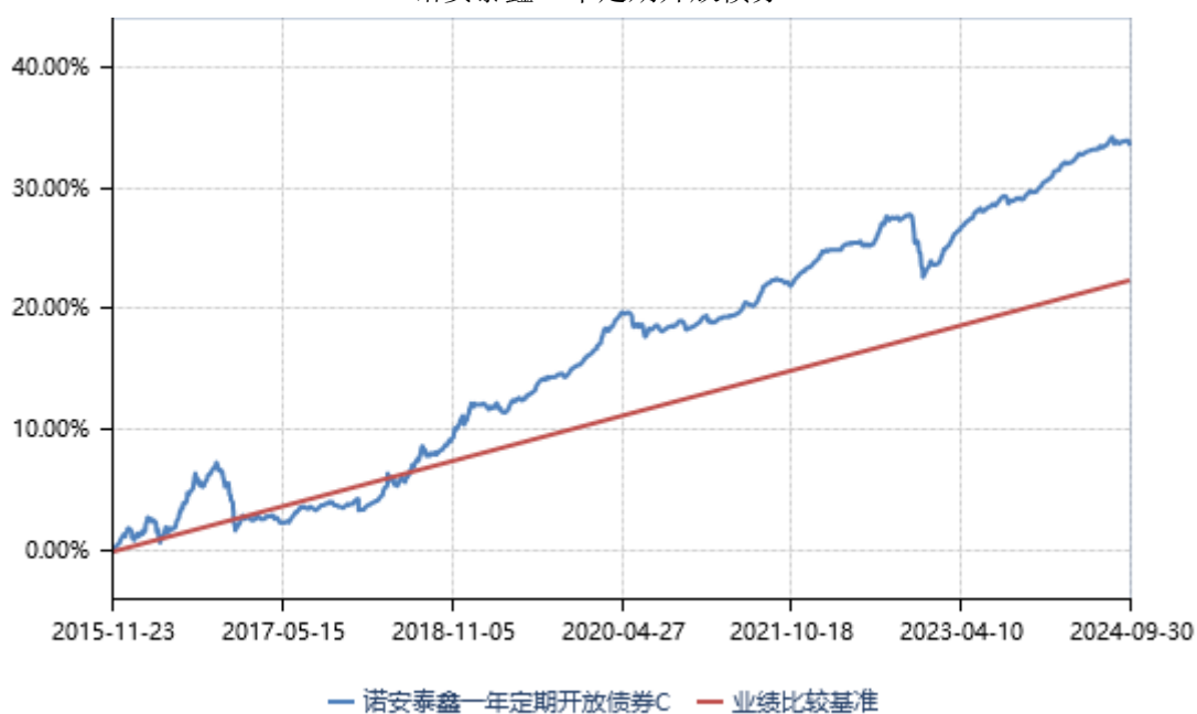
诺安泰鑫一年定期开放债券 D