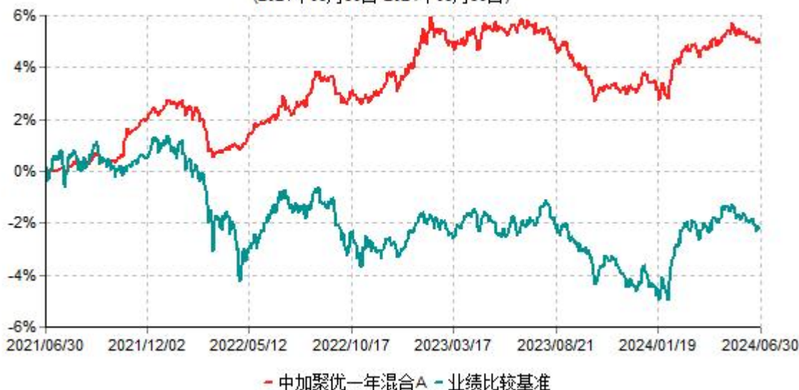
中加聚优一年混合A累计净值增长率与业绩比较基准收益率历史走势对比图 (2021年06月30日-2024年06月30日)