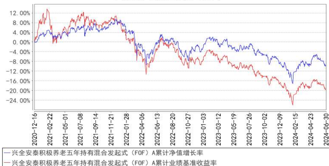
兴全安泰积极养老五年持有混合发起式（FOF）A累计净值增长率与同期业绩比较基准收益率的历史走势对比图