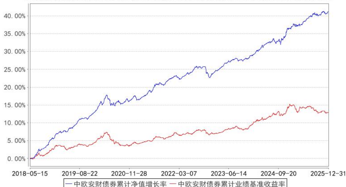
中欧安财债券累计净值增长率与同期业绩比较基准收益率的历史走势对比图