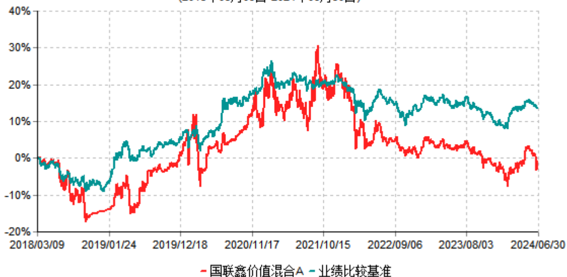
国联鑫价值混合A累计净值增长率与业绩比较基准收益率历史走势对比图 (2018年03月09日-2024年06月30日)