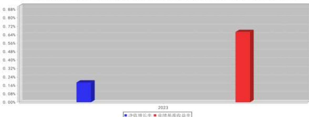
大成惠祥纯债债券C基金每年净值增长率与同期业绩比较基准收益率的对比图（2023年12月31日）