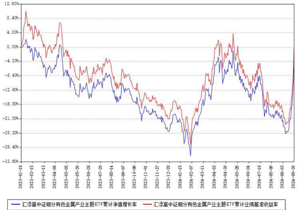
汇添富中证细分有色金属产业主题ETF累计净值增长率与同期业绩基准收益率对比图