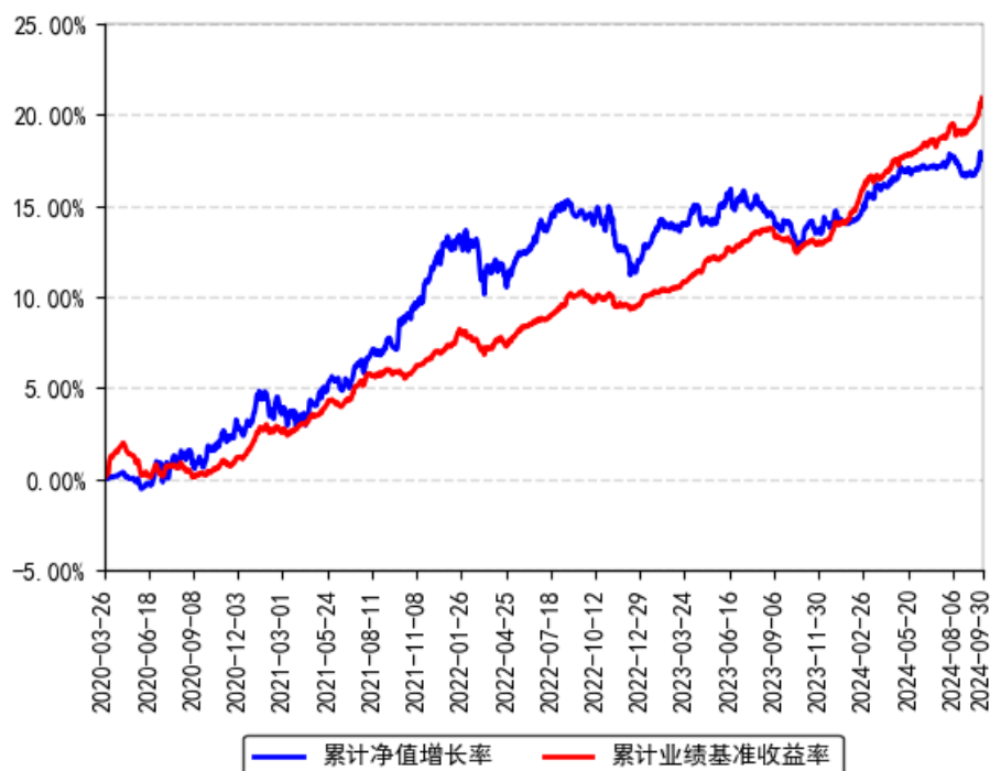
南方集利18个月持有债券A累计净值增长率与同期业绩比较基准收益率的历史走势对比图