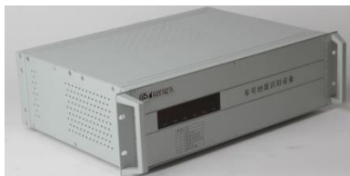
车号地面识别设备