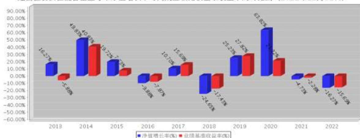
建信社会责任混合基金每年净值增长率与同期业绩比较基准收益率的对比图（2022年12月31日）