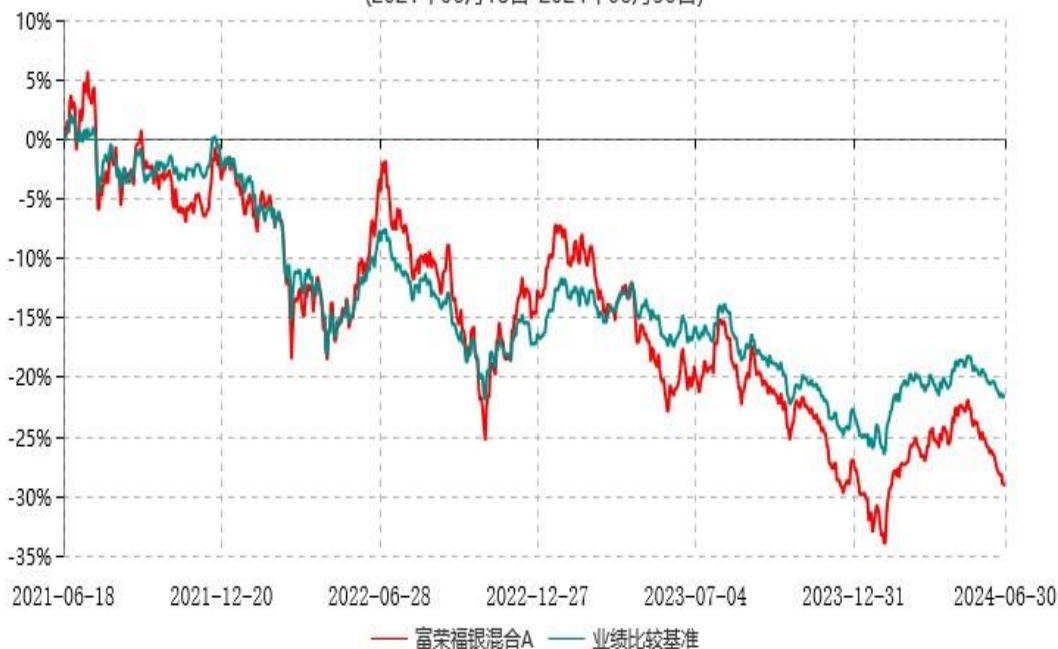
富荣福银混合C累计净值增长率与业绩比较基准收益率历史走势对比图