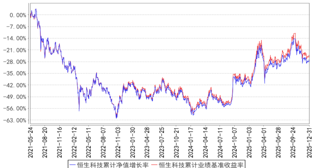
恒生科技累计净值增长率与同期业绩比较基准收益率的历史走势对比图

注：图示日期为 2021 年 5 月 24 日至 2025 年 12 月 31 日。