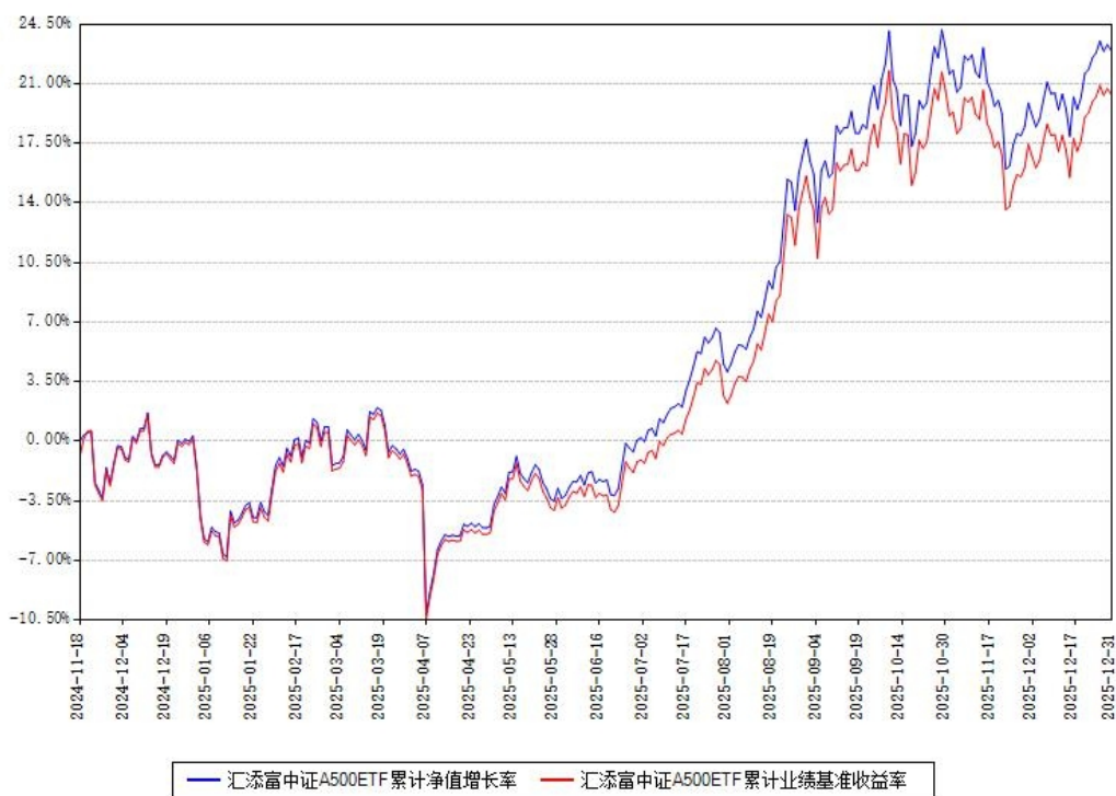
汇添富中证 A500ETF 累计净值增长率与同期业绩基准收益率对比图

注：本基金建仓期为本《基金合同》生效之日（2024 年 11 月 18 日）起 6 个月，建仓期结束时各项资产配置比例符合合同约定。