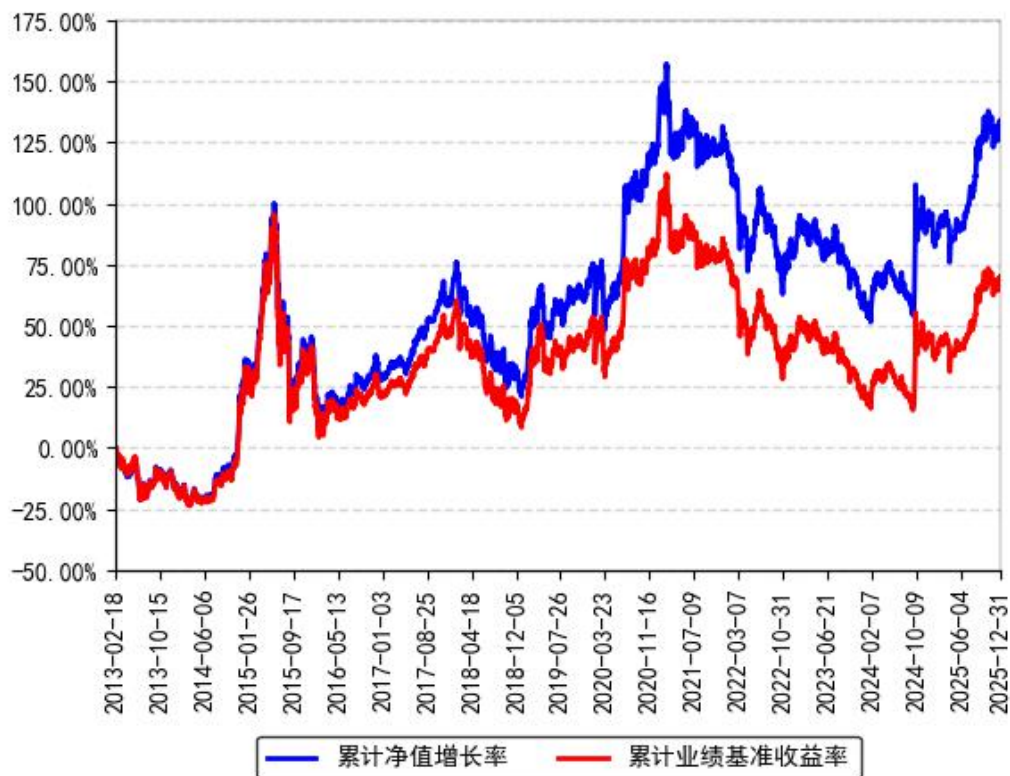
南方沪深300ETF累计净值增长率与同期业绩比较基准收益率的历史走势对比图