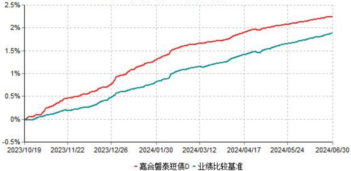
嘉合磐泰短债D累计净值增长率与业绩比较基准收益率历史走势对比图 (2023年10月19日-2024年06月30日)

注：本基金于2023年10月19日增设D类基金份额，D类基金份额实际存续从2023年10月19日开始。