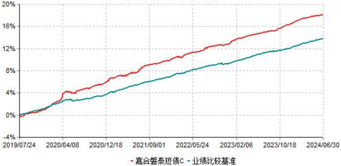
嘉合磐泰短债C累计净值增长率与业绩比较基准收益率历史走势对比图 (2019年07月24日-2024年06月30日)