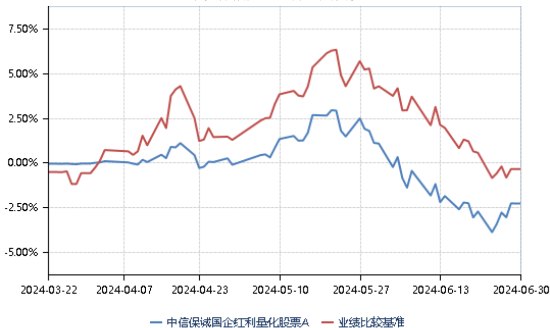
中信保诚国企红利量化股票 A