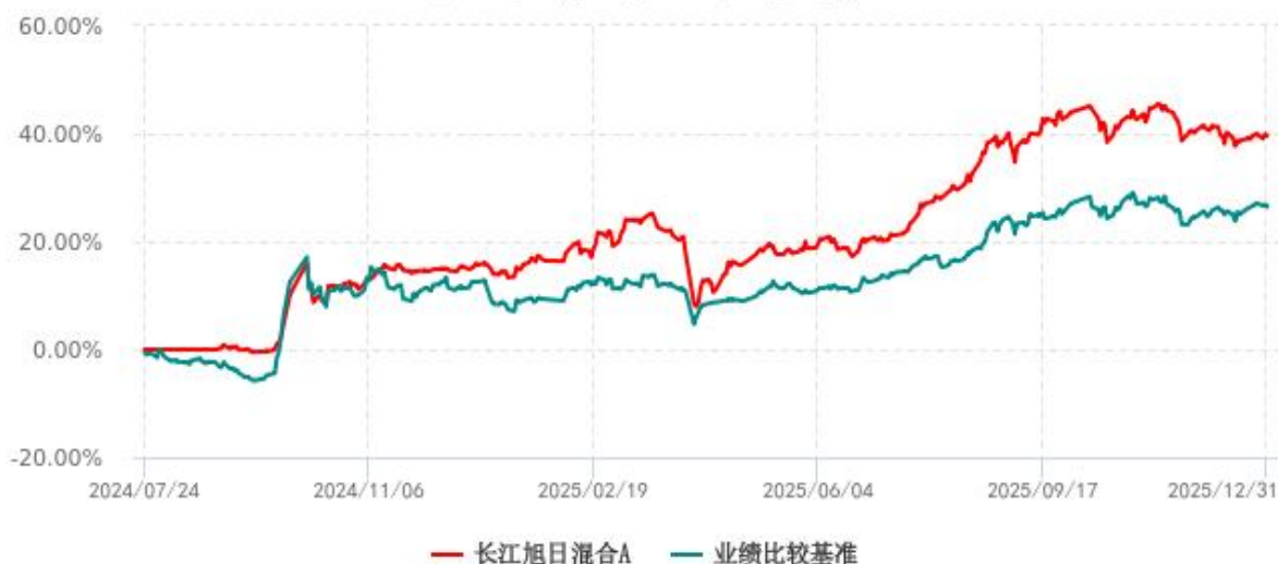
长江旭日混合A累计净值增长率与业绩比较基准收益率历史走势对比图 (2024年07月24日-2025年12月31日)